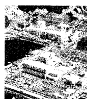
島根原発 3号機、安全審査へ 中国電、新規稼働目指し申請