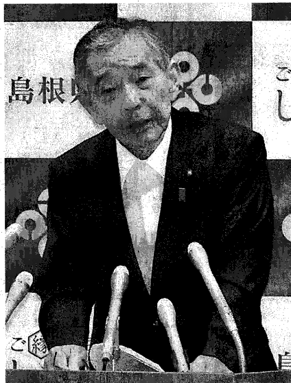
島根原発3号機の審査申請了解を表明する溝口知事＝県庁